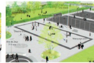
FITNESS ET AGRÈS