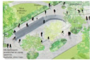
PISTE DE GLISSE